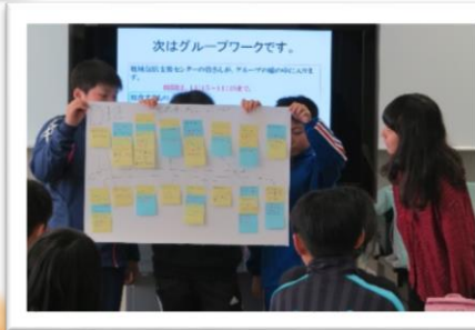
発表も上手でした!